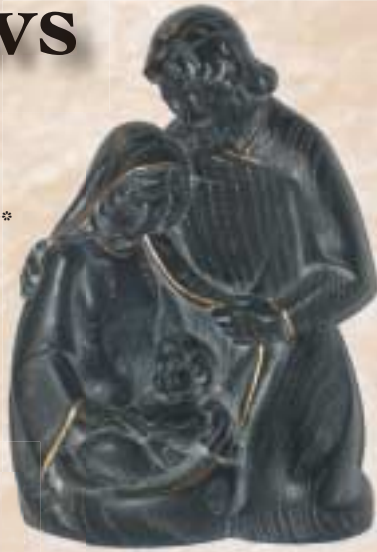
Ganzjahreskrippe | Sacra Famiglia | block Crib