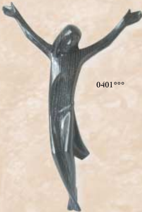
Kruzifix | Crocefisso | Crucifix - Vian